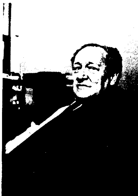
Si no se hubiera llevado a cabo la descentralización en Mapfre, su negocio se vería reducido en un 30 %.

El Proyecto de Ley de Seguros lleva años en las agendas de los diferentes directores generales de Seguros que