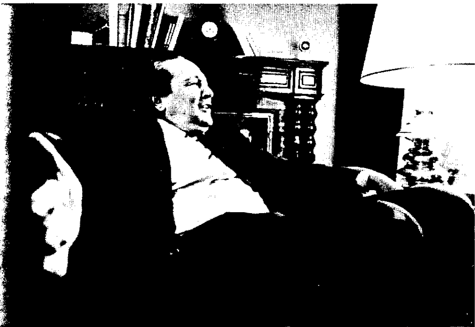
A Ignacio Hernando de Larramendi le llamaron loco cuando reestructuró Mapfre. Ahora es un mito.

En Mapfre no estamos pensando en la creación de talleres propios. Algunas compañías se lo han planteado, pero nosotros no. Lo que vamos a crear es un taller de investigación y análisis, pero no entrará en competencia con los talleres de reparación de automóviles. Es, en cierto modo, una escuela de formación y de investigación de tiempos, para que nuestros peritos sepan calibrar mejor los siniestros y poder aplicar métodos modernos que aumenten la productividad. El camino hacia el futuro nos lleva a una mayor eficacia y sofisticación de los talleres, pero al margen de las compañías de seguros. D